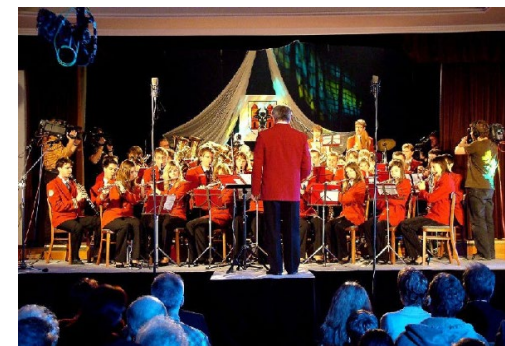
Dechový orchestr Haná

Dechový orchestr Haná při ZUŠ B. Kozánka si také vybudoval pevné místo mezi dechovými orchestry. Kapela složená z 83 členů má ve svém repertoáru skladby od renesanční doby až po současnost. Od klasické české a moravské dechovky po jazzové a swingové úpravy, pochody i rozsáhlé koncertní skladby.