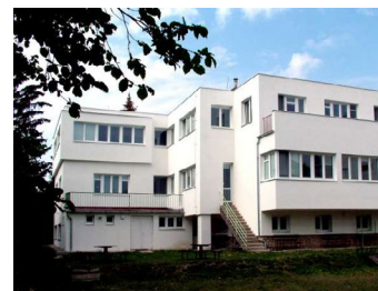
Budova výtvarného oboru