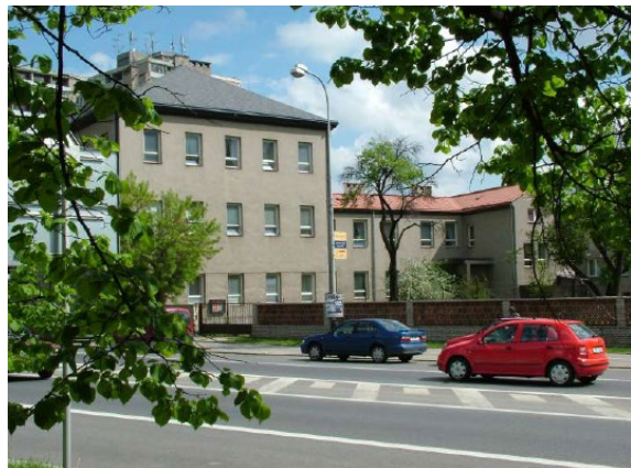
Hlavní budova školy